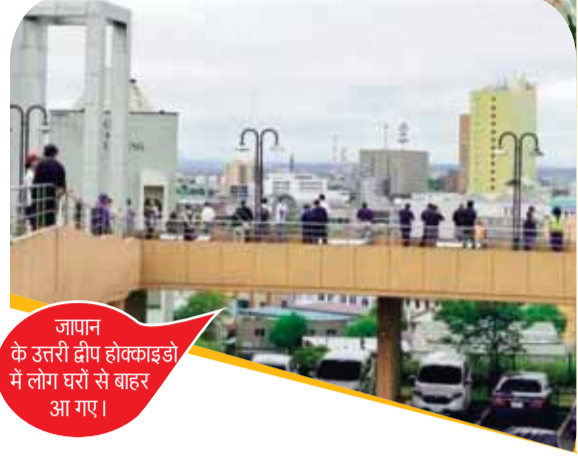
जापान के उत्तरी द्वीप होक्काइडो में लोग घरों से बाहर आ गए।