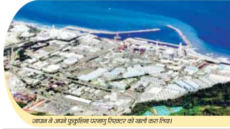
जापान ने अपने फुकुशिमा परमाणु रिएक्टर को खाली करा लिया।