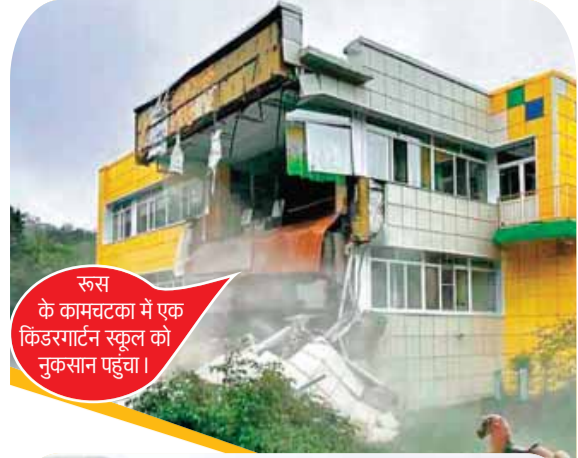
रूस के कामचटका में एक किडरगार्टन स्कूल को नुकसान पहुंचा।

भूकंप से अमेरिका के अलास्का और हवाई द्वीप तक सुनामी की लहरें पहुंचीं। कैलिफोर्निया में लोगों को समुद्र के किनारे से दूर रहने की चेतावनी दी। चीन, फिलीपींस, इंडोनेशिया, न्यूजीलैंड, पेरू और मेक्सिको ने भी अपने तटीय इलाकों में सुनामी अलर्ट जारी किया है। कैमेलिन के प्रवक्ता दिमित्री पेसकोव ने कहा कि भूकंप से किसी के हताहत होने की खबर नहीं है। मजबूत इमारतों और अलर्ट सिस्टम की वजह से बड़ा नुकसान नहीं हुआ।