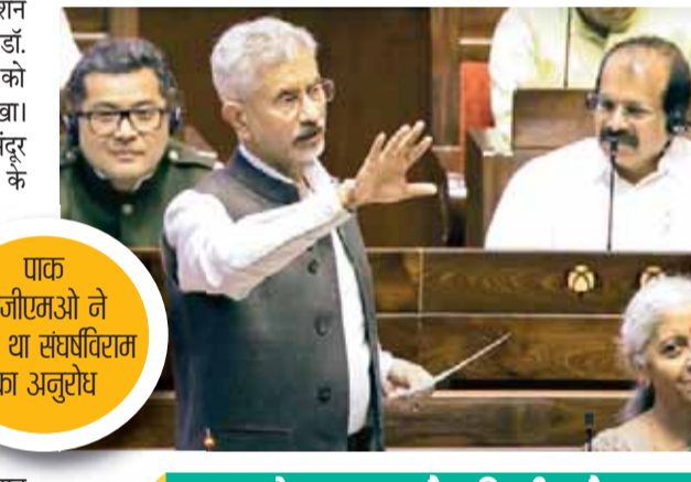
पाक डीजीएमओ ने किया था संघर्षविराम का अनुरोध

जयशंकर ने कहा कि जब ऑपरेशन सिंदूर शुरू हुआ तो कई देश यह जानना चाहते थे कि स्थिति कितनी गंभीर है और ये हालात कब तक चलेंगे, लेकिन हमने सभी को एक ही संदेश दिया कि हम किसी भी मध्यस्थता के लिए तैयार नहीं हैं। हमारे और पाकिस्तान के बीच कोई भी समझौता द्विपक्षीय तौर पर ही होगा। हम पाकिस्तानी हमले का जवाब दे रहे हैं, और देते रहेंगे