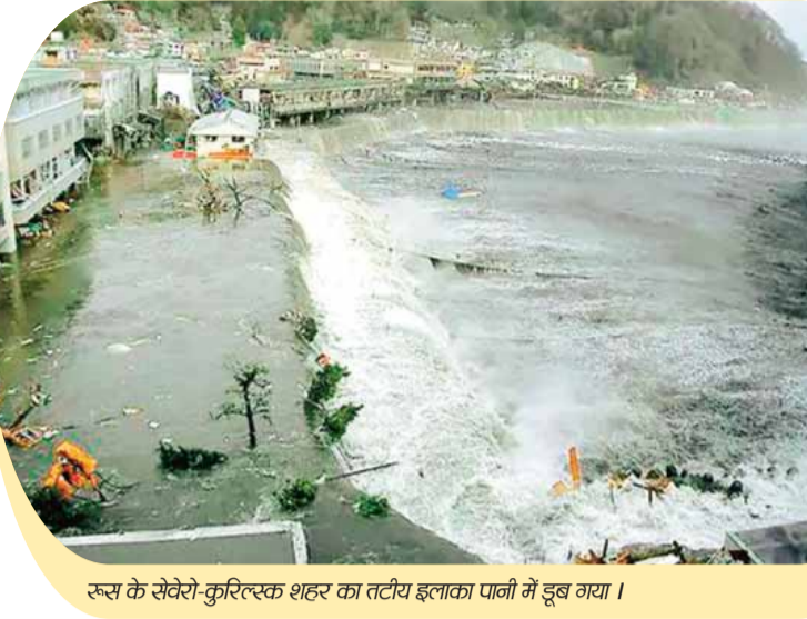
रूस के सेवेरो-फुरिल्स्क शहर का तटीय इलाका पानी में डूब गया।

रूस के पूर्वी प्रायद्वीप कामचटका में दुनिया का छठा सबसे बड़ा भूकंप आया है। यूएस जियोलॉजिकल सर्वे के मुताबिक भूकंप की तीव्रता 8.8 थी। भूकंप का केंद्र जमीन से 19.3 किलोमीटर की गहराई में था। यह भारतीय समयानुसार बुधवार सुबह 4:54 बजे आया। कामचटका में 5 मीटर तक ऊंची सुनामी आई है। इसकी वजह से कई इमारतों को नुकसान पहुंचा है। भूकंप से जापान के पूर्वी तट के पास एक फुट ऊंची पहली सुनामी लहरें पहुंची हैं।